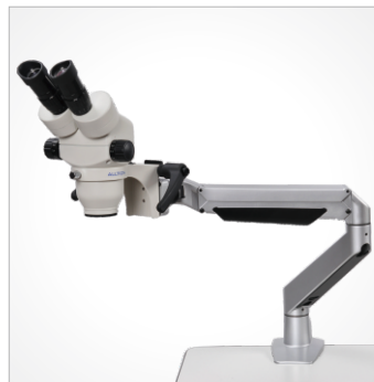
BS: 双目 桌面夹挂式弹簧臂支架带手柄