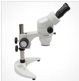
BC: 双目 月牙形底座