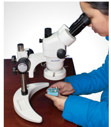
0745: 7X至45X连续变倍显微镜