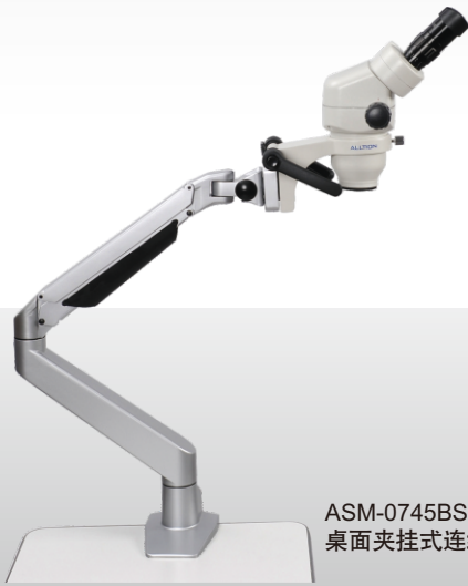
ASM-0745BS 桌面夹挂式连续变倍(7X-45X)双目显微镜