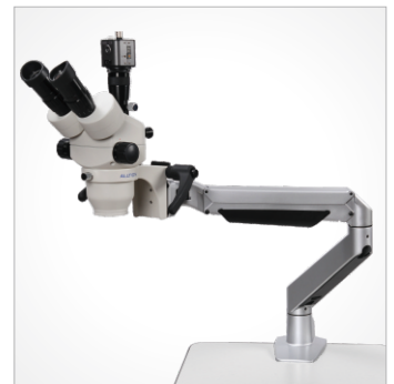
TS: 三目 桌面夹挂式弹簧臂支架带手柄