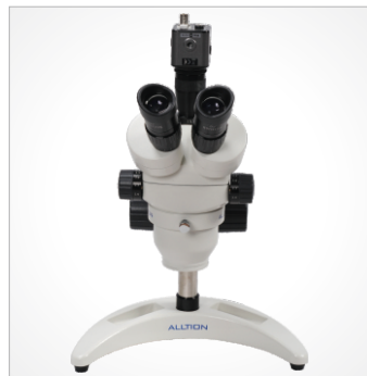
TC: 三目 月牙形底座